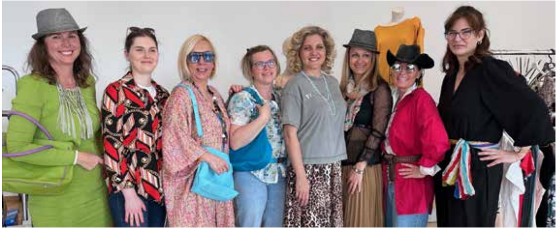
FRAUEN-KLEIDER-Tauschparty. Am 8. März 2025 (Weltfrauentag) verwandelte sich das Kulturzentrum Hacker Haus in eine lebendige Austauschplattform für modebewusste und umweltbewusste Frauen. Die Veranstaltung FRAUEN-KLEIDER-Tauschparty organisiert von der Initiative Familienfreundliche Gemeinde, lockte zahlreiche Besucherinnen an, die in entspannter Atmosphäre Kleidung, Schmuck, Taschen und Schuhe tauschten. Dabei war das Motto „Feiere dich als Frau, gemeinsam mit anderen Frauen“ besonders spürbar. ●