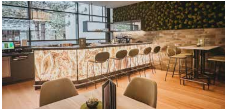
Die neue Saunabar beeindruckt mit neuen Lounge-Möbeln.

Das Thermen- und Wellnessresort Linsberg Asia präsentiert sich zu Beginn des Jahres 2025 in neuem Look. Mit gezielten Investitionen wurden Hotel, Therme und Seminarbereich modernisiert und optisch aufgewertet – für noch mehr Wohlfühlatmosphäre und Komfort für Thermen- und Hotelgäste. Im Hotelbereich erstrahlen das Hotelfoyer, die Rezeption und der Empfangsbereich durch helle Farben und dezente Wandmalerei in neuem Glanz. Eine grüne Oase mit Fotopoint lädt zum Verweilen ein und setzt natürliche Akzente. Die Pianobar wurde einem stilvollen Relaunch unterzogen, während die neugestalteten Übergangsbereiche zum Restaurant ein harmonisches Ambiente schaffen. Mit modernster Seminartechnik setzt das Hotel