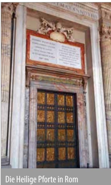
Die Heilige Pforte in Rom